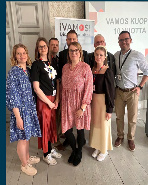
Vamos Kuopion tiimi juhli 10-vuotista taivaltaan Kuopion Muotoiluakatemiolla – vuosikymmen nuorten rinnalla kulkemista ja polkujen vahvistamista.

Kummiperhetoiminta 10 vuotta. Kummiperhetoiminta käynnistyi Diakonissalaitoksella kymmenen vuotta sitten. Kriisin keskellä syntyneestä ideasta on kasvanut kiinteä osa monen nuoren ja perheen arkea. Vuosikymmenessä Kummiperhetoiminta on yhdistänyt yli 300 yksin Suomeen tullutta nuorta ja perhettä. Kummiperhetoiminnassa erilaiset kulttuurit ja tavat elää kohtaavat ja kehittyvät yhdessä. Haasteista huolimatta hyvät tarinat ja merkitykselliset kohtaamiset ovat toiminnan ytimessä. Tilaisuutta juhlittiin alppikadulla Auroran olohuoneessa 27.10.2025. Mukana juhlimassa oli kummeja, nuoria, verkostokumppaneita. Tilaisuudessa kuultiin nuorten ja kummien kokemuksia, nautittiin Eastern Melodies -musiikkiesityksestä sekä nautittiin herkuista.